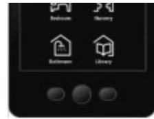
InSideControl Interface P139043